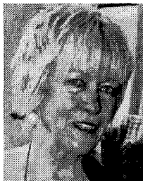
Il ministro Tremonti, in alto a sinistra la sorella minore Angiola Tremonti